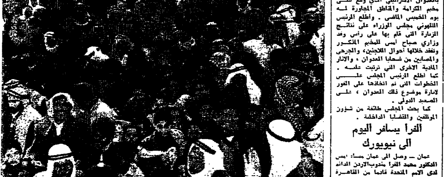
المواطنون يستقبلون السيد بهجت التلهوني رئيس الوزراء لدى زيارته لمخيم الكرامة